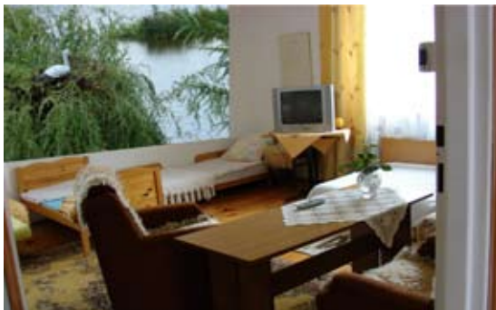
fot. 3. Fototapety często przedstawiają przyrodę; można zamówić indywidualny wzór

Fototapeta to zdjęcie naniesione na papier lub podkład winylowy – w tej wersji jest zmywalna. W handlu dostępna jest bardzo duża oferta z najróżniejszymi zdjęciami, począwszy od antycznych ruin, poprzez pejzaże, portrety zwierząt, wodę w rozmaitych odmianach, a kończąc na wzorach graficznych, z gier komputerowych itp. Można też zamówić tapetę według własnego pomysłu (fot. 3).