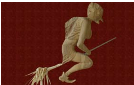
fot. 4. Tapeta tekstylna może być wykonana z mięsistej tkaniny o wyraźnej fakturze

Spodnią warstwą jest papier, zaś wierzchnią włókna naturalne (jedwab, bawełna, len) lub sztuczne (akryl, wiskoza, włókna polimerowe). Często podkład papierowy jest umieszczany na flizelinie, a tak wykonane tapety są nieco mięsiste, mają też bardziej plastyczne wzory (fot. 4).