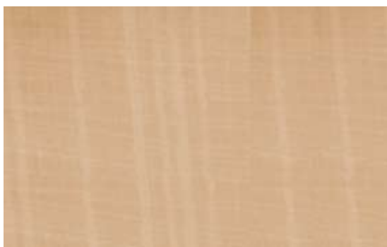
fot. 1. Jednowarstwowa tapeta papierowa jest najpopularniejsza

Produkowane są jako jedno- lub dwuwarstwowe; przez niektórych producentów określane jako simplex i duplex (fot. 1). Ich powierzch-