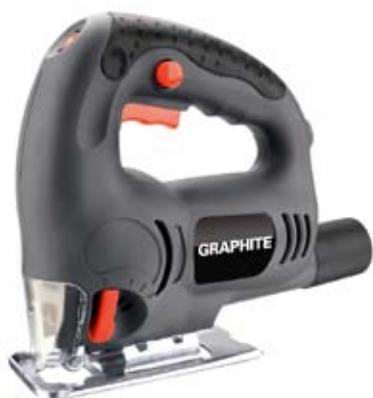
fot. 3 GRAPHITE 58G060