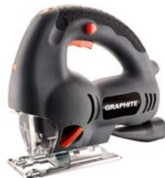
fot. 1 GRAPHITE 58G071