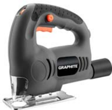
fot. 4 GRAPHITE 58G045