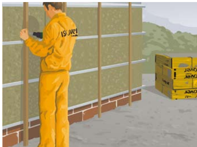
fot. 3. Do metalowego rusztu mocujemy drewnianą konstrukcję wsporczą co 60 cm

Skuteczność tak wykonanego docieplenia zależy od starannego przeprowadzenia prac. Można je wykonywać w dowolnej porze roku, nawet pracując np. tylko w weekendy. Jedyne etap ułożenia izolacji termicznej i osłonięcia jej folią wiatrochronną powinien być przeprowadzony na tyle szybko, żeby ocieplenie nie zamokło w razie deszczu.