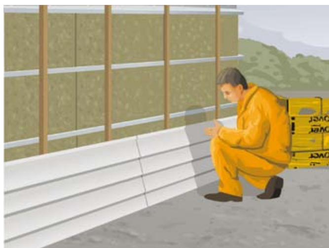
fot. 4. Do drewnianego rusztu przykręcamy warstwę wykończeniową - np. siding