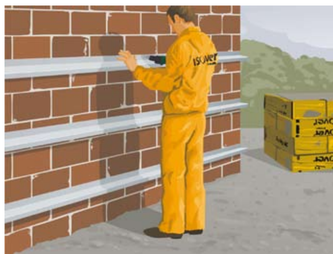
fot. 1. Na murze montujemy ruszt z profilu stalowego typu Z co 60 cm