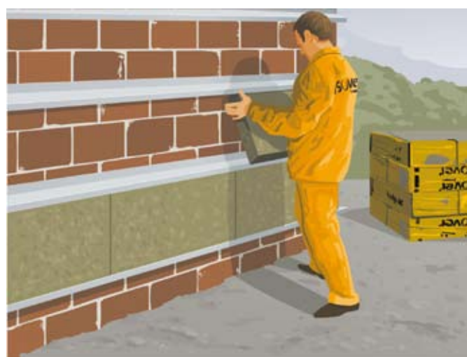
fot. 2. Między rusztem układamy płyty wełny mineralnej